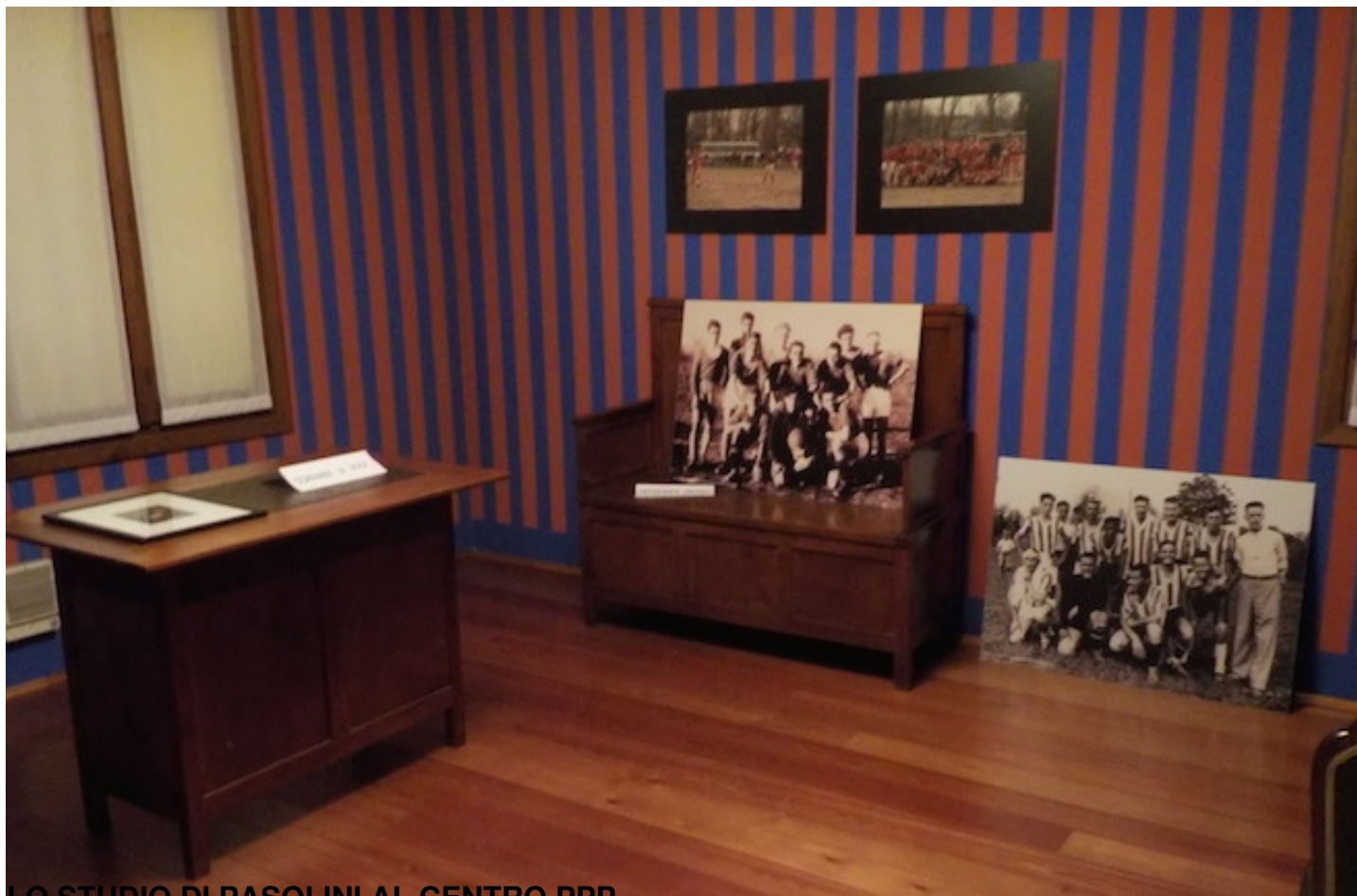
LO STUDIO DI PASOLINI AL CENTRO PPP